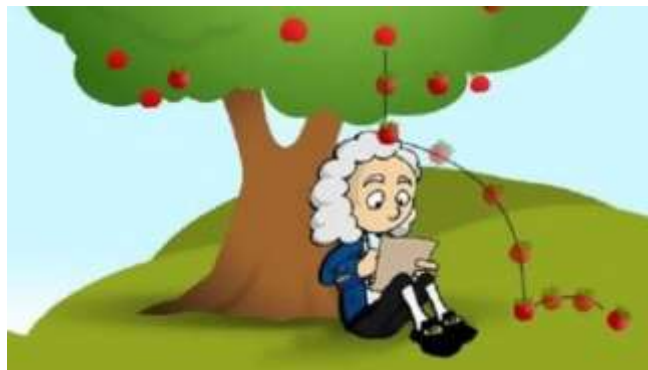
Gambar 2. Gambar Materi di Media Videoscribe

awal pembelajaran. Kemudian, media videoscribe di sajikan pada fase ketiga yaitu melaksanakan investigasi peserta didik memperhatikan videoscribe yang ditayangkan oleh guru, sehingga peserta didik di dalam kelompok mencari sumber informasi untuk saling memberi gagasan atau ide, saling menganalisis, mensintesis informasi yang di dapat, menyimpulkan informasi dan membuat keputusan dengan bantuan media videoscribe . Media videoscribe memuat beberapa mata pelajaran tergabung dengan subtema di tema 7 yang akan dipelajari untuk di investigasi oleh peserta didik, di dalam videoscribe terdapat materi yang di sajikan dalam bentuk animasi yang menarik dan interaktif bagi peserta didik, sehingga proses pembelajaran dapat lebih bermakna dan menunjang keberhasilan proses pembelajaran. Adapun berikut salah satu gambar dari videoscribe yang digunakan, yaitu: